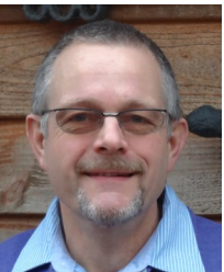
Best. Convoy 78