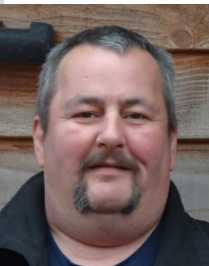
Best. Convoy 569