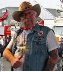
Klub president. Convoy 01