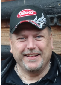
Næstformand: Convoy 148