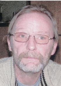
Kasser.: Convoy 850 " Fynboen"