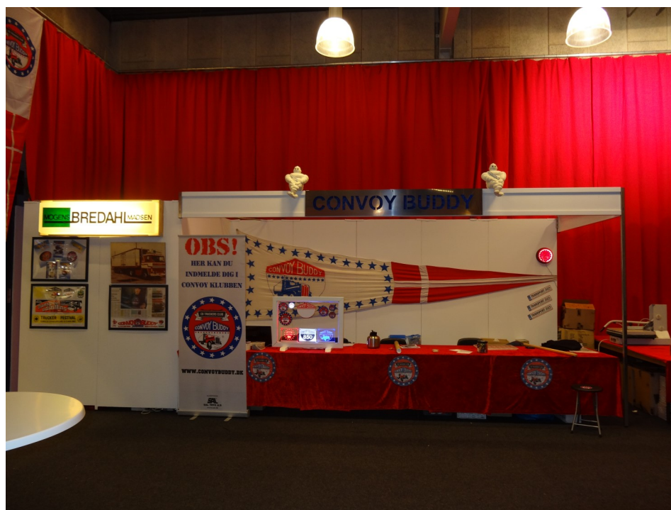
”Transport gennem Tiden”

Transport 2015 er overstået, den blev besøgt af 22068 besøgende , og de fik en på opleveren, Der var virkelig sat alle sejl til fra alles side, og et sandt overflødhedshorn af nyt materiale samt ny opbygninger i et væld af udformninger var linet op på fine- ste maner, om end det var en smule koldt så blev man mødt af varme på standene rundt om i hallerne. Her er lidt billeder fra en velbesøgt hal J3 som blev et tilbageblik på 100 år's transport materiale.